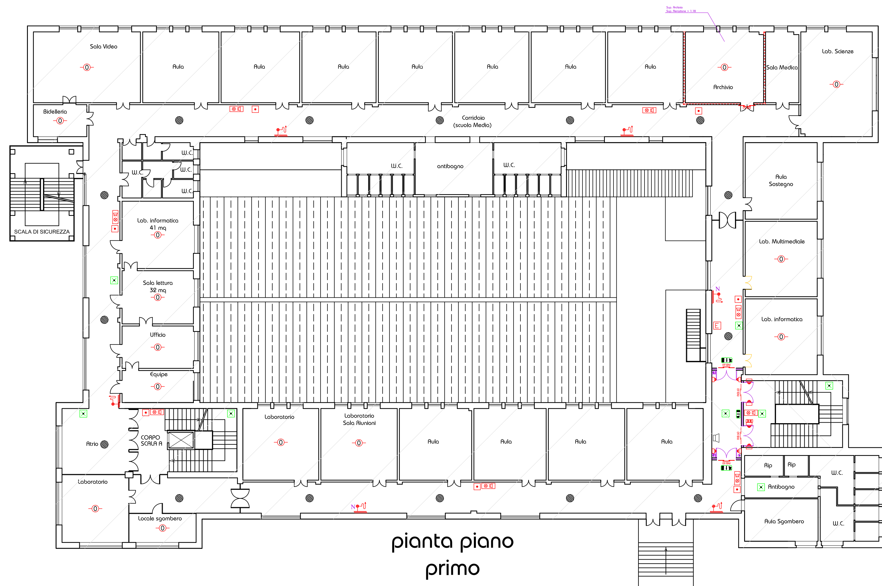
piano piano primo